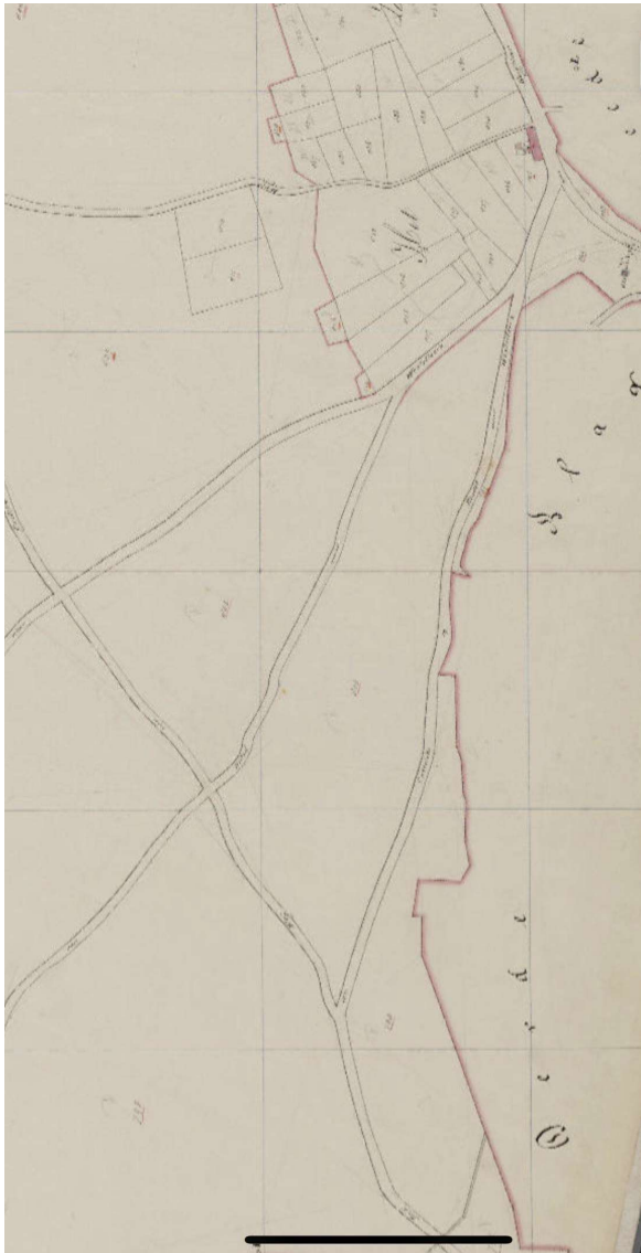
Situatie in 1832

In de afbeelding van 2024 krijg je een beeld van de huidige loop van de zandweg tussen de 2 ronde stippen (bij tekst 'Weg Bladel'). Er lijkt een stukje "verdwenen" maar dit is fysiek nog aanwezig. Door recht van overpad tijdens de ruilverkaveling zijn er nieuwe paden "ontstaan".