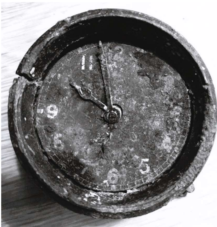
Het klokje uit de Spitfire

In 2009 hebben Piet, Sjef van Dingenen en Ad van Zandvoort op de crashlocatie nog opgraving gedaan en er nog div. vliegtuigonderdelen uit de grond gehaald waaronder het dashboardklokje dat om 9.58 uur is stil blijven staan, het vermoedelijk tijdstip van de crash.