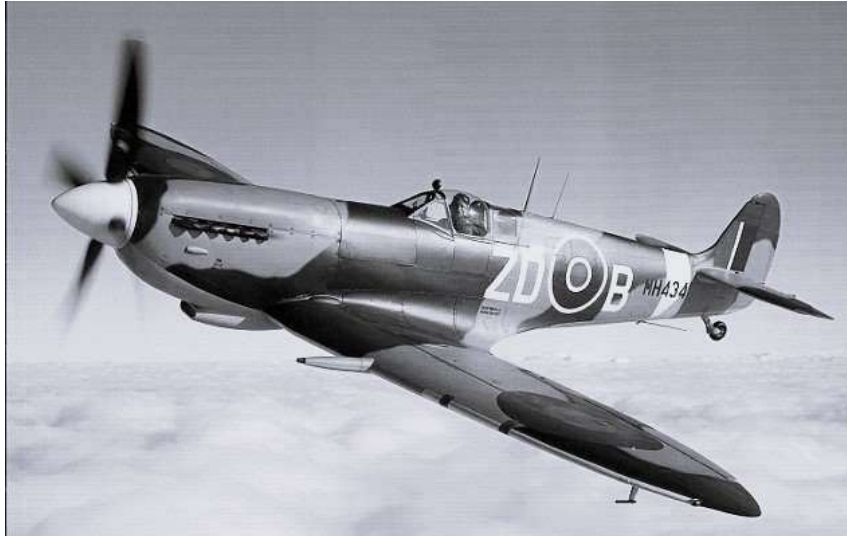
Spitfire MK IX