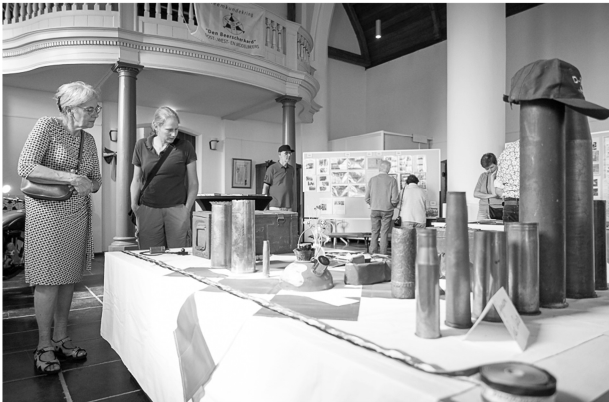
Expositie in het Oude Kerkje

Een unieke bijdrage aan de sfeer van de expositie was het carillon van het Oude Kerkje, dat elk uur tussen 13:00 en 17:00 het lied "We'll Meet Again" van Vera Lynn speelde, een muzikaal eerbetoon dat herinnerde aan de hoop en verbondenheid tijdens de oorlogsjaren. De belangstelling voor de expositie was groot, en bezoekers werden meegenomen in een reis door de geschiedenis die de blijvende impact van de bevrijding op de Beerzen liet zien.