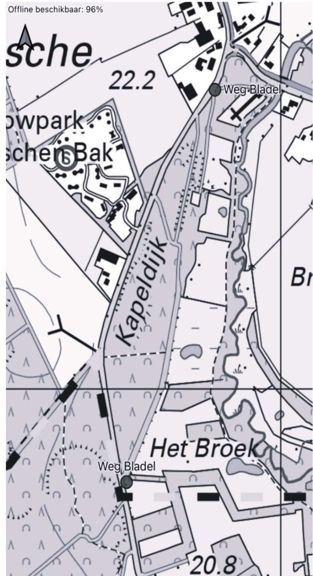
Situatie in 2024