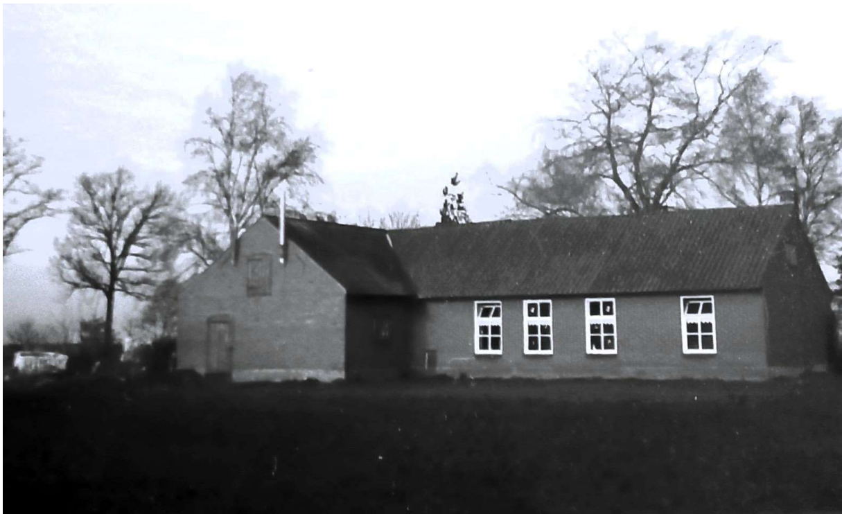
De voormalige noodwoning aan de Kattenbergseweg, maart 1984.

De noodwoning werd in november 1952 vervangen door de huidige boerderij aan de Voorteindseweg 18 waardoor deze boerderij niet in aanmerking kwam als 'Wederopbouwboerderij'.