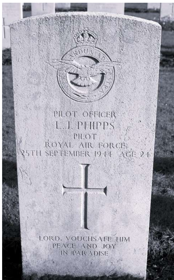
Het graf van Pilot Officer aan de Ruytershovenweg te Bergen op Zoom. Graf 1644060 / begraafplaatsnr. 1028 Plaatsaanduiding 24.C.06